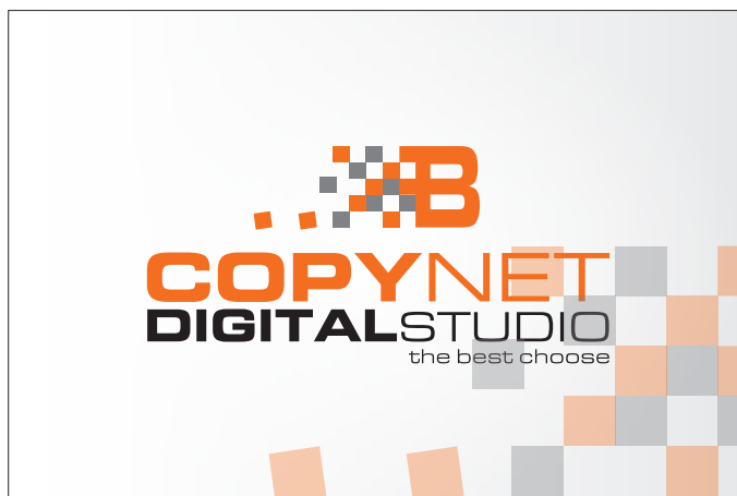
FILE DELLA GRAFICA

Per ottenere questo effetto dovrete inviarci due file (o due pagine del medesimo file), una per la grafica e uno contenente la "maschera" vettoriale delle zone da lucidare: